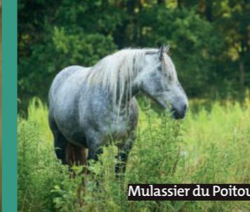
Mulassier du Poitou